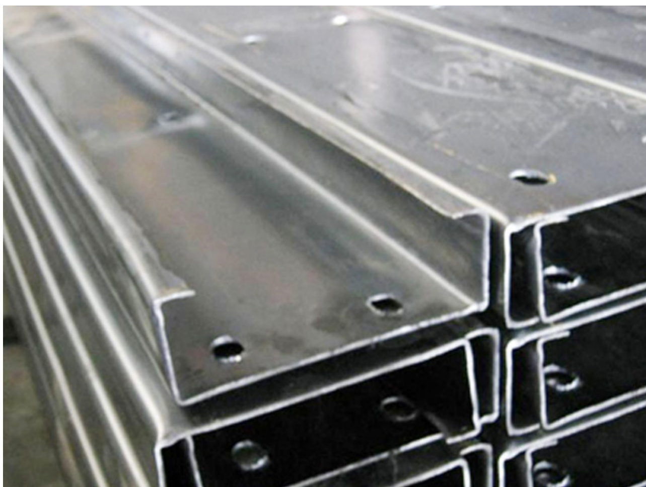
Xà gồ chữ C