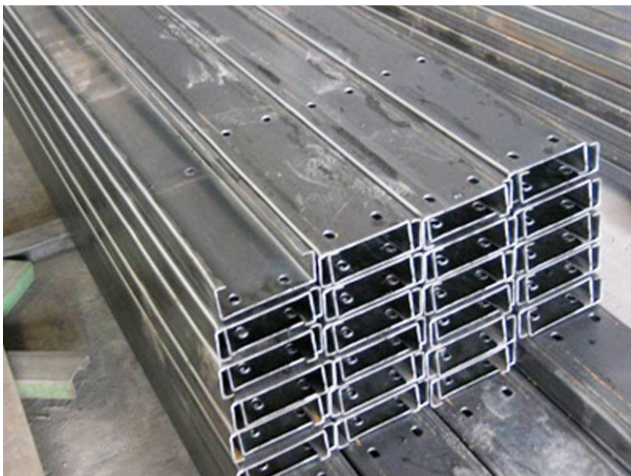
Xà gồ chữ C